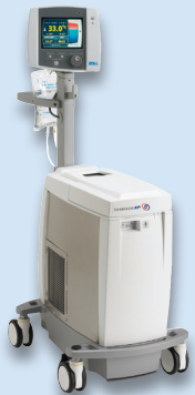
Das Thermogard XP System (TGXP-System) für das intravaskuläre Temperaturmanagement (IVTM).

Weitere Informationen finden Sie in den Referenzmaterialien zur Gebrauchsanweisung der Katheter oder unter www.zoll.com/de .